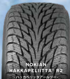
NOKIAN HAKKAPELIITTA® R2 - ハッカペリッタアルツー -